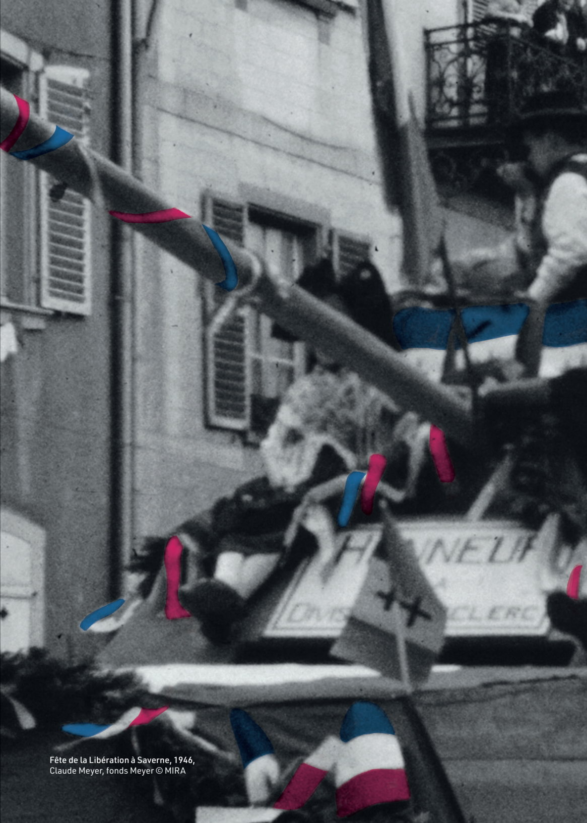
Fête de la Libération à Saverne, 1946, Claude Meyer, fonds Meyer © MIRA